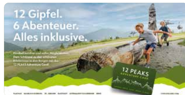
©12 PEAKS Adventure Card